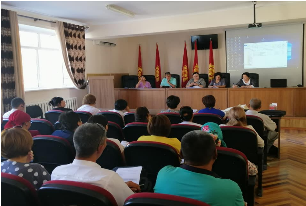
Фото с мероприятий