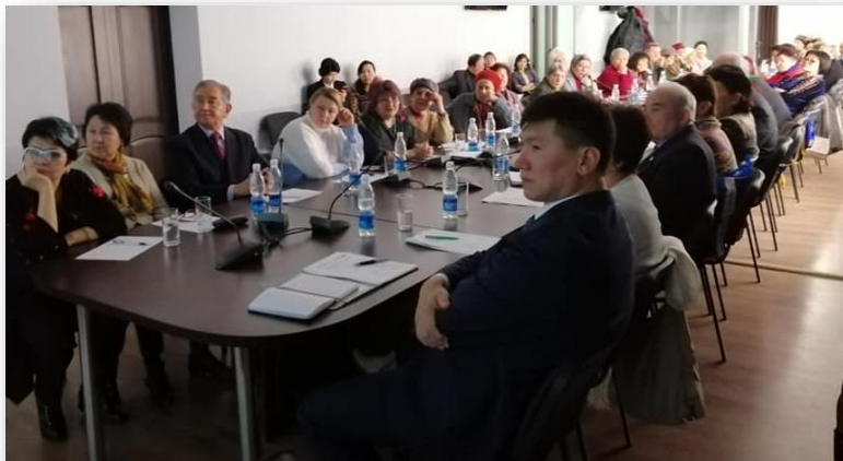
КС в МТСР по обсуждению проекта НКПП 26.12.2018 г.

• Организованная совместная площадка для обсуждения и согласования проекта НКПП с участием представителей Аппарата Правительства КР, Жогорку Кенеша КР, руководства Министерства труда и социального развития КР, членов рабочей группы по разработке НКПП членов Сети AgeNet International и пожилых граждан, способствовала ускорению процесса доработки и принятия Правительством КР проекта Программы, реализация которой позволит в будущем значительно улучшить правовое и социально-экономическое положение пожилых граждан КР. Сформированная в рамках проекта общественная мониторинговая группа по реализации НКПП позволит сформировать культуру общественной оценки деятельности государственных органов, участия граждан в оценке эффективности реализации НКПП и их активизации;