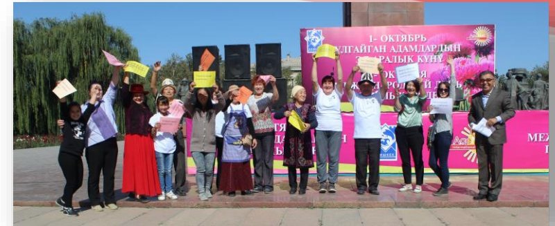
Флеш моб "Голос пожилых" в рамках ярмарки «От сердца к сердцу», 3.10.18 г. Бишкек

• Сеть стала более узнаваема, и повысился интерес к детальности Сети. Так, по итогам проекта поступили заявления на вступление в Сеть от 8 организаций из 6 стран (Кыргызстан, Казахстан, Таджикистан, Азербайджан, Россия, Узбекистан). Вступление в сеть новых членов позволит повысить количественный и качественный состав Сети и усилить ее потенциал. Также повышение интереса к деятельности Сети подтверждается увеличением числа подписчиков в Facebook на 20% через опубликованную и распространенную информацию о мероприятиях Сети AgeNet в рамках данного проекта.