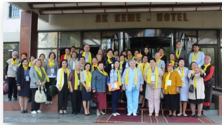
Конференция Сети AgeNet International, 1-2.10.18 г Бишкек