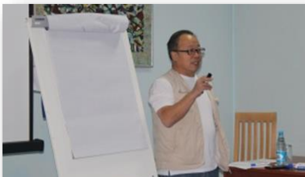
Рисунок 1Тренинг по стратегированию Сети Age Net International, 3.10.18 г. Бишкек