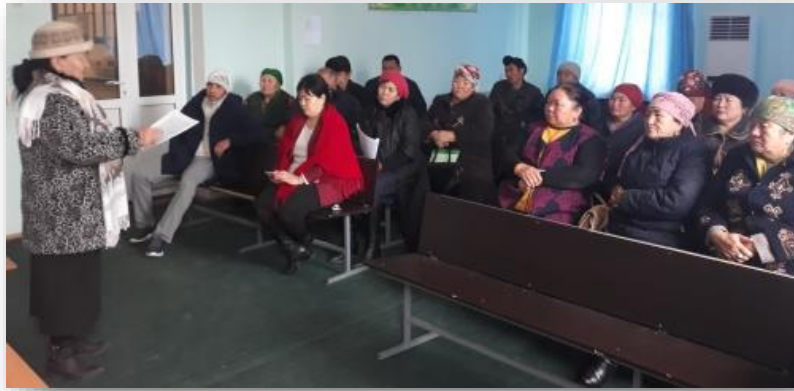
Тренинг МОС Джалал-Абад по предвыездной подготовке для социальных педагогов

28 ноября 2018г. на проведенных МОСами тренингах 22 чел. (18 жен, 4 муж) (г. Джалал-Абад), а также 25 чел. (17 жен, 8 муж) (Каракол) повысили знания по предвыездной подготовке. По итогам тренинга в г. Каракол участники подписали Соглашение о совместном сотрудничестве, и разработали совместный комплексный план по работе с мигрантами и членами их семей, который был согласован с вице-мэром г. Каракол.