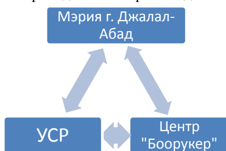
Рис. 3. Механизм предоставления социальной поддержки

В качестве положительного примера предлагается рассмотреть взаимодействие УСР г. Джалал-Абад с мэрией г. Джалал-Абад. УСР составляет бюджет на целый год, который утверждается на заседании городского кенеша и в течение года работа проводится строго по утвержденному плану и бюджету. Списки на оказание социальной поддержки из местного бюджета составляет УСР. Денежные средства, выделенные на социальную защиту из местного бюджета, перечисляются на счет Центра «Боорукер» при мэрии.